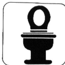
Manter as instalações sanitárias em boas condições de higiene.

Os procedimentos acima ilustrados servem para evitar a nossa contaminação por vários microorganismos que nos causam doenças, especialmente, os protozoários.