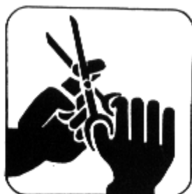
Conservar sempre as unhas cortadas e limpas.