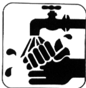
Lavar as mãos antes das refeições e após usar os sanitários.

As figuras abaixo foram extraídas da bula de um medicamento e representam procedimentos que podem ser adotados na prevenção de algumas doenças.