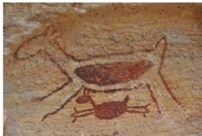
4) Símbolo do PARNA da Serra da Capivara