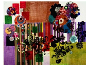
5) Avenida Brasil – 2003-2004