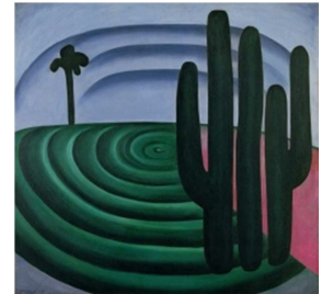
3) Distância – 1928