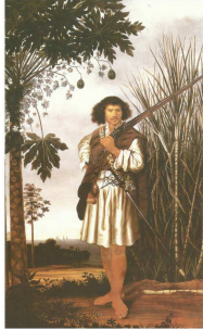
1) Mulato - 1641

Olhando as imagens abaixo de pinturas de estilos variados, relacione as pinturas de cada uma das imagens ao respectivo autor.