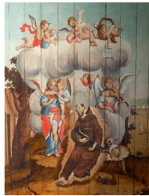
2) São Francisco de Assis Agonizante S/D sacristia da Igreja da Ordem Terceira de São Francisco de Assis.