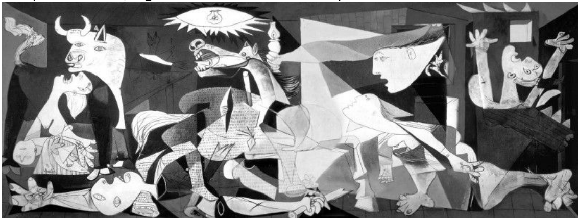
Figura: PICASSO, Pablo. Guernica , 1937, Museu Rainha Sofia (Madri).

Guernica , de Picasso, traz a ideia do repúdio aos horrores de uma guerra específica. Uma pessoa que não conheça as intenções conscientes de Picasso pode ver Guernica e sentir ou não impactos marcados pela intenção do artista e pode sentir outros, gerados pela relação entre as imagens da obra de Picasso e os dados de sua experiência pessoal. Um exemplo de outros impactos gerados pela experiência pessoal é o caso do adolescente que, vendo a figura a seguir, a relaciona a uma explosão nuclear. Assim, a forma artística vai além das intenções do artista, logo é INCORRETO afirmar que: