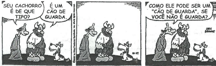
BROWNE, Dik. Folha de S. Paulo , 30 nov. 2002.

34 - A preposição “ DE ” estabelece qual relação entre as palavras cão e guarda na fala de Hagar e de Eddie?