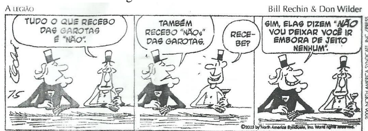
A legião. Jornal da Tarde , São Paulo, 15 out. 2003.

O vocábulo “NÃOs” no segundo quadrinho é um exemplo do seguinte processo de formação das palavras: