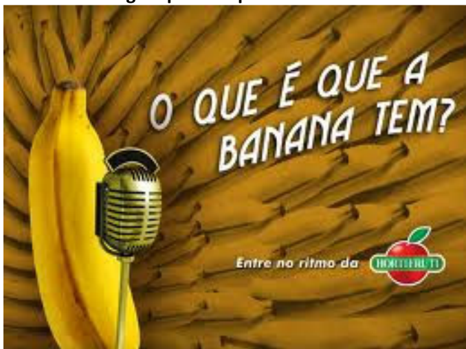
Imagem para as questões 09 e 10:

Disponível em: www.profmaquinaqueti.blogspot.com Acesso: 25/08/2015