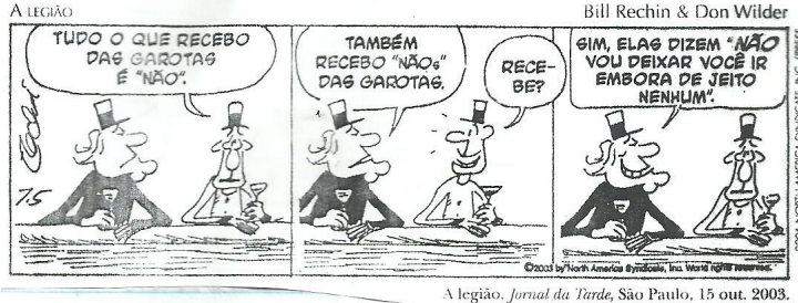
A legião. Jornal da Tarde , São Paulo, 15 out. 2003.

O vocábulo “NÃOs” no segundo quadrinho é um exemplo do seguinte processo de formação das palavras: