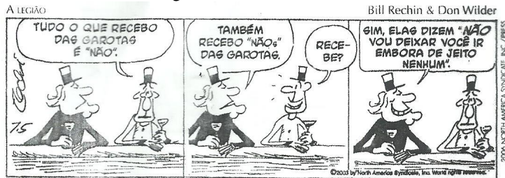
A legião. Jornal da Tarde , São Paulo, 15 out. 2003.

O vocábulo “NÃOs” no segundo quadrinho é um exemplo do seguinte processo de formação das palavras: