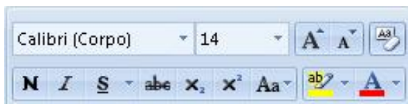
Figura 5 – Visão parcial dos ícones do Microsoft Word 2007

Para responder à questão 20, considere a Figura 5 abaixo: