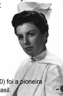
Anna Nery (1814-1880) foi a pioneira da enfermagem no Brasil.

A Escola de Enfermagem Anna Nery/EEAN da Universidade Federal do Rio de Janeiro/UFRJ, primeira Escola de Enfermagem no Brasil, surgiu no contexto do movimento sanitarista brasileiro do início do século XX. Em 90 anos de existência a instituição registra um papel histórico-social de vanguarda, na expansão e desenvolvimento da enfermagem em nosso País. Destacam-se nesse percurso, entre outras realizações, a criação da Associação Brasileira de Enfermeiras Diplomadas (1926), atualmente Associação Brasileira de Enfermagem – ABEn; a criação de novas escolas de enfermagem; a organização de hospitais e centros de saúde, formação e qualificação de enfermeiros Especialistas, Mestres, Doutores e em Programas de Pós-Doutorado, principalmente, em todas as regiões do país e na perspectiva de Cooperação Técnica e Científico-Cultural com alguns países da América Latina (Argentina, Colômbia, México, Peru) e da África (Angola e Moçambique).