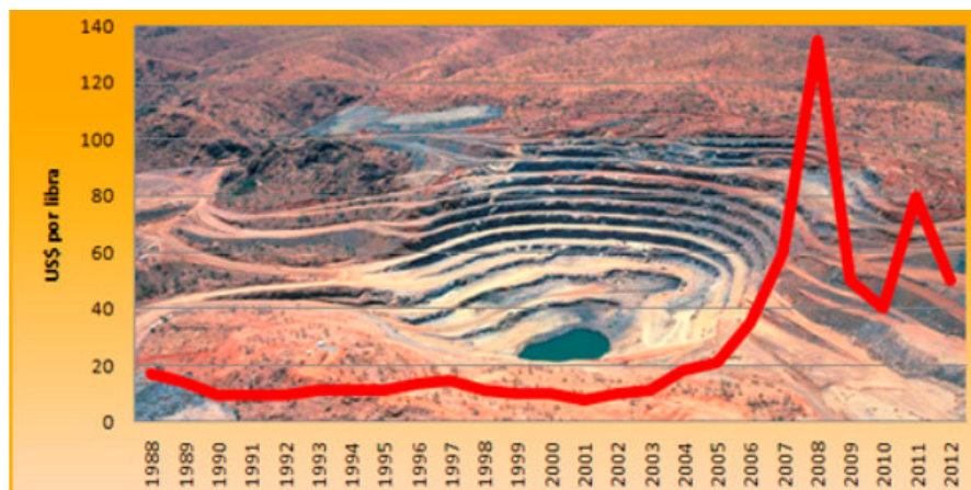
Evolution of Uranium Prices