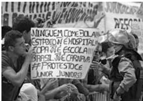
(Manifestação em Fortaleza em Junho de 2013)

Durante a realização da Copa das Confederações (junho de 2013), a imprensa nacional e internacional registrou inúmeras imagens de protestos ocorridos nas principais cidades brasileiras.