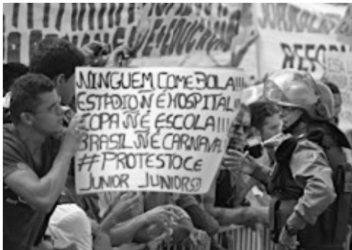
(Manifestação em Fortaleza em Junho de 2013)

Durante a realização da Copa das Confederações (junho de 2013), a imprensa nacional e internacional registrou inúmeras imagens de protestos ocorridos nas principais cidades brasileiras.