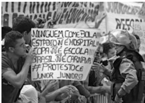
(Manifestação em Fortaleza em Junho de 2013)

Durante a realização da Copa das Confederações (junho de 2013), a imprensa nacional e internacional registrou inúmeras imagens de protestos ocorridos nas principais cidades brasileiras.