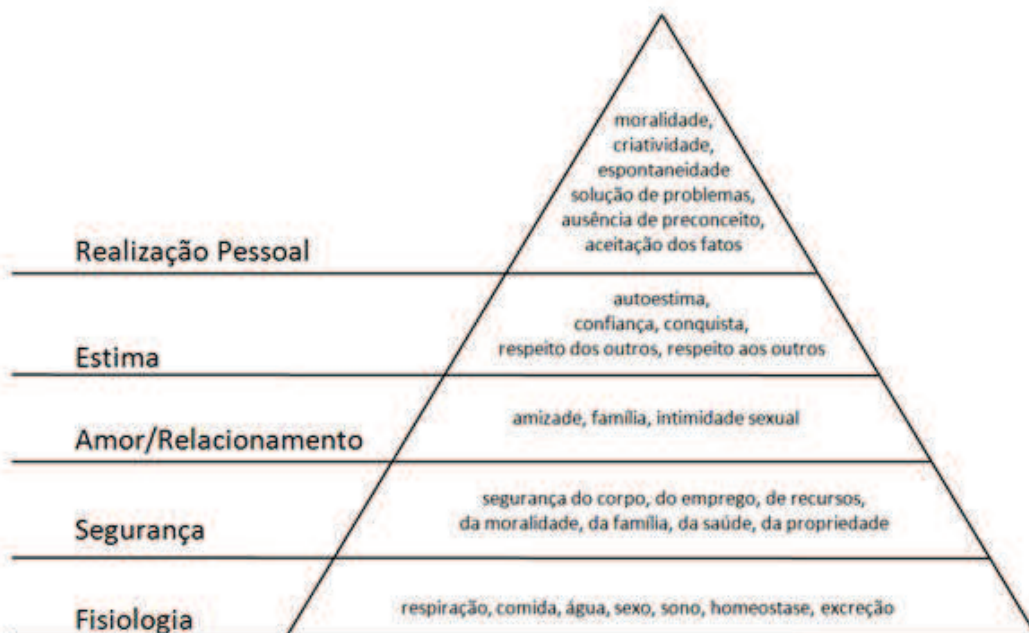
Imagem ampliada da questão 32 da página 9:

Imagem ampliada da questão 31 da página 9: