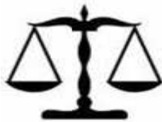
balança de dois pratos

Utilizando uma balança de dois pratos e sem depender da sorte, o número mínimo de pesagens que permite identificar, com certeza, a moeda falsa é: