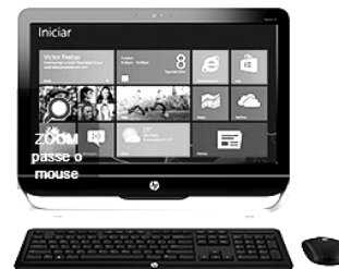
Computador HP All in One 23-b010br com Intel Core i3 4GB 1TB LED 23" Windows 8

A citação “4GB” faz referência ao seguinte tipo de memória: