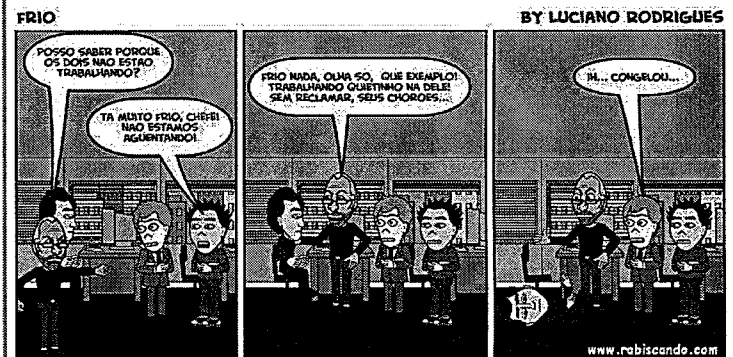
Acesso em 26 de dezembro de 2012.

De acordo com a Teoria dos Dois Fatores de Herzberg, o aspecto destacado na tirinha anteriormente apresentada, quando corretamente gerenciado no ambiente organizacional, é considerado: