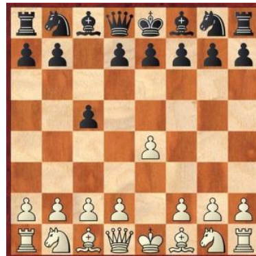
Lance 1. Pretas