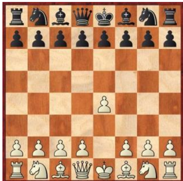
Lance 1. Brancas