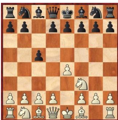
Lance 2. Brancas