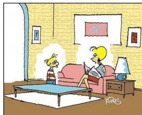
Não, meu filho, você não foi baixado pela internet. Você nasceu! Atitude Móvel ( http://www.atitudemovel.com.br/2010/11/charge-no-atm-origem.html )