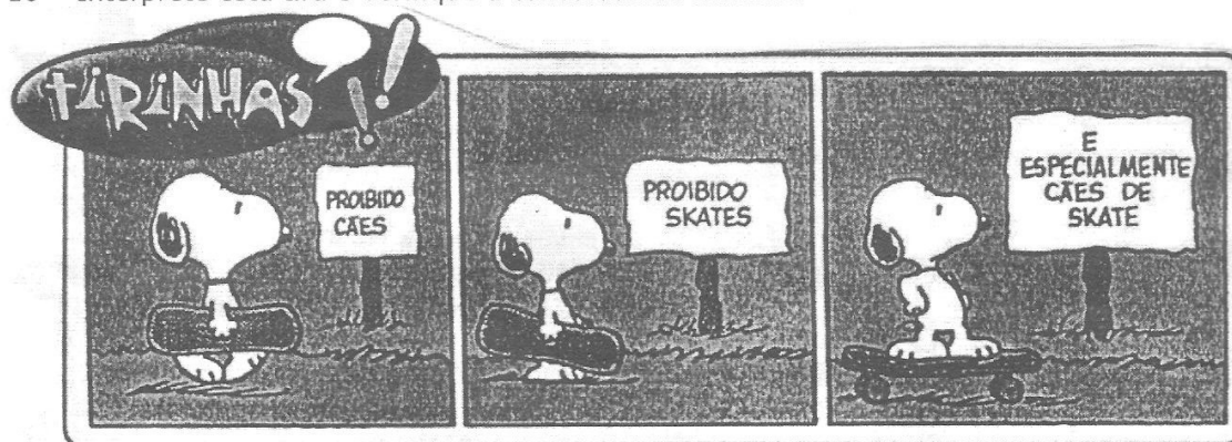
SCHULZ, Charles. Revista Recreio . São Paulo: Abril, ano 1, n. 47

10 - Interprete esta tira e verifique a concordância nominal.