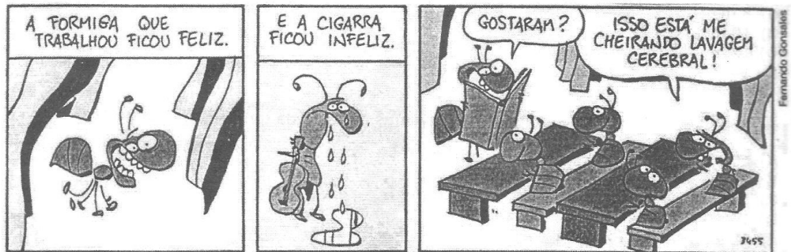
Niquei Náusea – Vá pentear macacos.