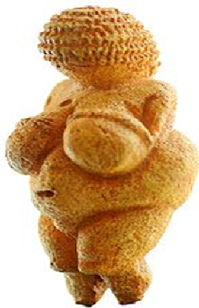
Figura 01 Mulher de Willendorf