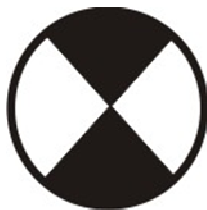
Figura 02 – Símbolo elétrico

31) Com base nos símbolos elétricos adotados pela NBR 5444, o desenho (Figura 02) abaixo representa: