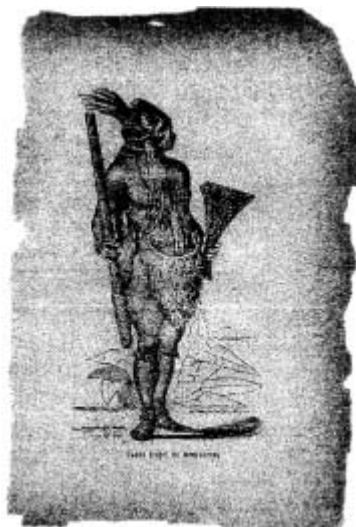
Figura 2 Índio Uapé do Amazonas

João Ribeiro. História do Brasil nas escolas primárias . Ed. de 1900.