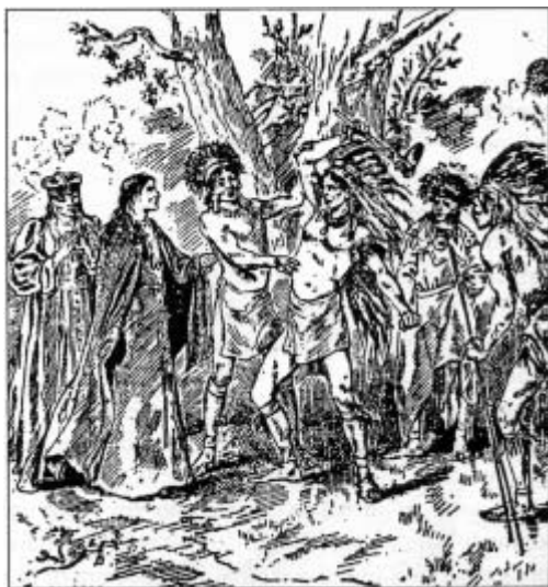
Figura 1 A morte do 1º Bispo do Brasil

Joaquim M. Lacerda. Pequena história do Brasil . Ed. de + ou -1870.