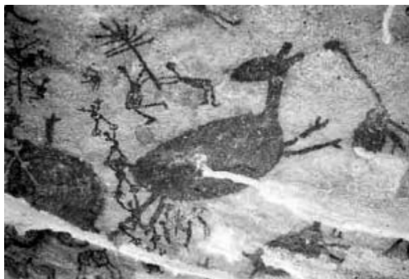
(Pintura rupestre do Parque Nacional da Serra da Capivara, São Raimundo Nonato (PI). )

Segundo especialistas, como arqueólogos e antropólogos, uma das razões que levaram as pessoas da pré-história a retratar figuras como as da imagem acima foi, provavelmente,