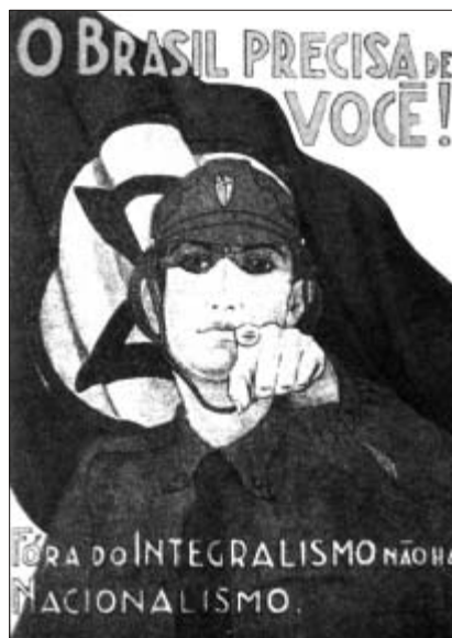
Cartaz da Ação Integralista Brasileira