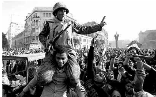
Clima nas ruas do Egito foi de grande festa durante todo o sábado [12.02.2011]; manifestante carrega soldado no Cairo