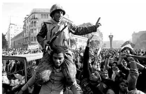
Clima nas ruas do Egito foi de grande festa durante todo o sábado [12.02.2011]; manifestante carrega soldado no Cairo