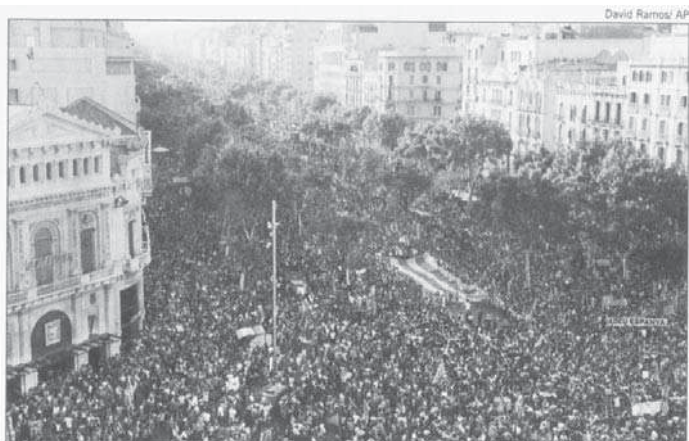
MULTIDÃO LEVANDO bandeiras catalãs se concentra em frente à Suprema Corte pelo direito à nação