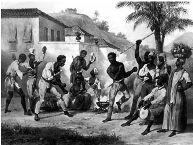
(Rugendas. Roda de capoeira , 1835, in: Circe M. F. Bittencourt. Ensino de História: fundamentos e métodos )

Considerando a concepção de História que fundamenta as proposições sugeridas nos PCN – História, a utilização dessa imagem proporciona as seguintes abordagens em sala de aula: