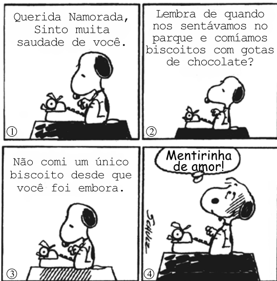
(Charles M. Schulz, Snoopy – Assim é a vida, Charlie Brown! Porto Alegre: L&PM Pocket, 2010)

09. No segundo quadrinho, as formas verbais sentávamos e comíamos são próprias do