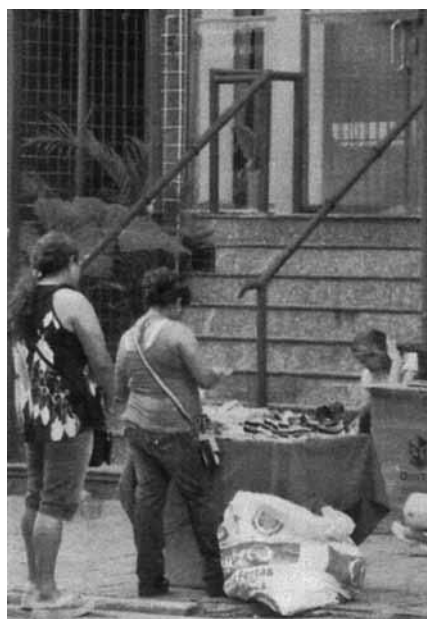
Nem tudo é perfeito: camelôs ilegais ainda aparecem quando a PM vira as costas.

Considere o texto da figura para responder às questões de números 13 e 14.