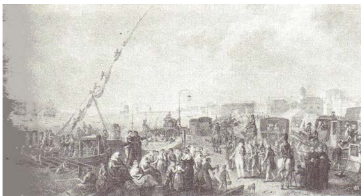
D. João VI. Partida do Príncipe Regente de Portugal para o Brasil em 1807.

(In. Boris Fausto. História do Brasil . São Paulo: EDUSP, 2008, p. 121)