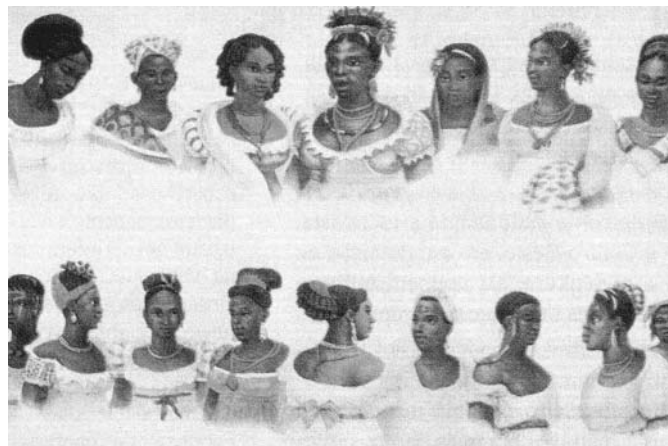
Jean-Baptiste Debret. éc. XIX.

http://www.imagememalta.com.br/resultados/mostrar.asp? Acesso em 05/11/2010