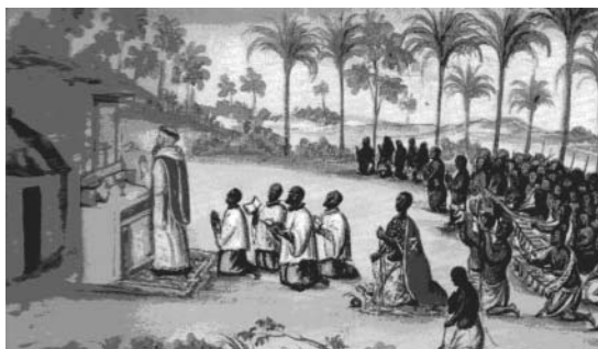
Adoção de elementos do catolicismo pelos chefes da região do Congo e de Angola foi tomada como uma vitória do trabalho de catequese junto aos africanos.

(...) os portugueses foram os pioneiros entre os europeus no contato com povos da África ocidental e central. Além de chegar ao ouro e encontrar outro caminho para as Índias, ainda queriam cumprir sua missão de propagadora do cristianismo. Naquela época, também na Europa era na religião que as pessoas buscavam a explicação das coisas, e os reis eram amados e respeitados acreditando todos que haviam sido escolhidos por Deus para ocuparem tal posição (...).