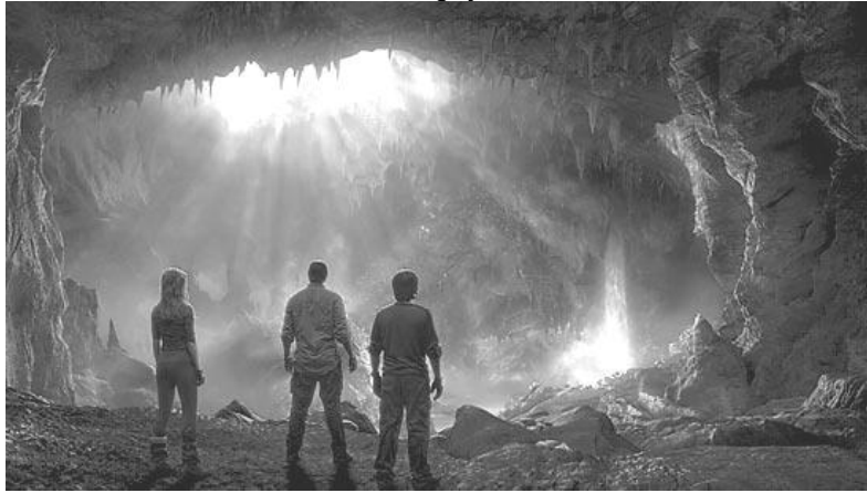
No coração do planeta Cena do filme Viagem ao Centro da Terra , de 2008. O fascínio de um mundo desconhecido sob nossos pés

Em Viagem ao Centro da Terra , o clássico de Júlio Verne, um grupo de aventureiros desce por uma fenda na crosta terrestre e encontra um mundo inteiramente novo, dentro de um espaço oco existente no centro do planeta. Nesse universo subterrâneo há ilhas, um oceano e até um sistema misterioso de iluminação. O francês Verne, que morreu em 1905, escreveu sobre viagens ao fundo do mar, à Lua e pelos ares muito antes que o submarino moderno, o foguete e o avião fossem inventados. Agora parece que ele também estava correto, pelo menos em parte, sobre a existência de um mar no interior da Terra. Um estudo produzido por cientistas da Universidade Estadual do Oregon, nos Estados Unidos, divulgado na quinta-feira passada, sugere a existência de grandes quantidades de água entre 250 e 650 quilômetros abaixo da crosta terrestre. Não são lagos nem cascatas encantadoras como os da ficção científica de Verne. Mas, de qualquer forma, a pesquisa revela a presença de água em profundidades antes inimagináveis.