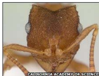
These ants do not need males