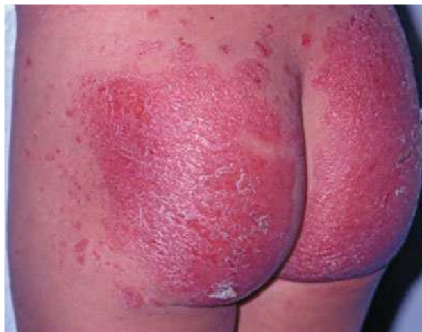
FIGURA 1: Acometimento isolado da região das fraldas

Dermatose é rara na infância e corresponde a cerca de 4% de todas as dermatoses observadas em doentes menores de 16 anos. A apresentação mais comum na primeira infância se caracteriza pelo surgimento de placas eritematosas bem delimitadas envolvendo a genitália e as regiões glúteas e periumbilical, tendendo a ser persistente e rebelde ao tratamento. O acometimento facial não é raro. Com o passar do tempo, novas placas eritematoescamosas tendem a surgir, acometendo, principalmente, o tronco e os membros.