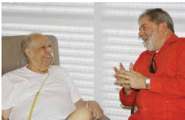
Lula visita José Alencar no hospital

Lula visita José Alencar e diz que vice está bem disposto