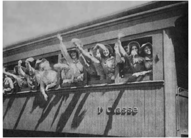
Chegada ao Rio de Janeiro do batalhão feminino "João Pessoa", em 15.11.1930.