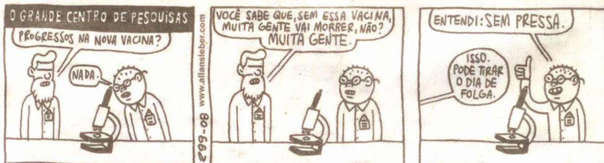
(SIEBER, Allan. Preto no branco/ O grande centro de pesquisas. Folha de S. Paulo, São Paulo, 25 maio 2008, Ilustrada, E11)