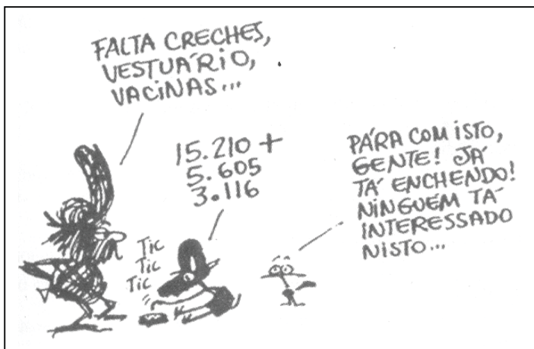
Henfil. A Volta da Graúna. 2 ed. São Paulo: geração Editorial, 1993:32.

10. Observe as falas das personagens da tira.