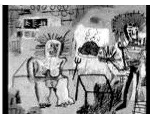
Arroz com Polo