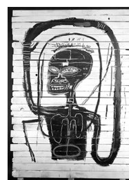
Basquiat flexible 1984

Um(a) arte-educador(a), ao propor uma atividade, organiza as seguintes atividades em artes visuais: