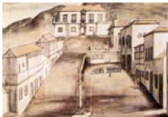
Ilustração de Viajante do Séc. XVIII, da atual Praça Tiradentes