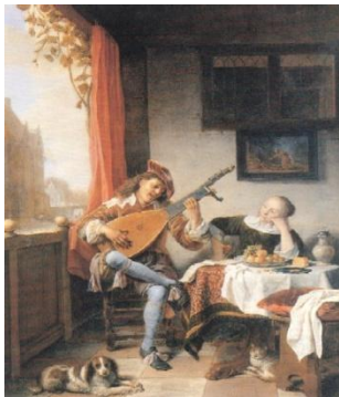
Figura 1: Hendrick Sorgh

26) Releitura de Joan Miró da obra “O Tocador de Alaúde” (1661), de Hendrick Sorgh: