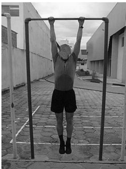
Figura 03 - Posição 3: Final do Exercício