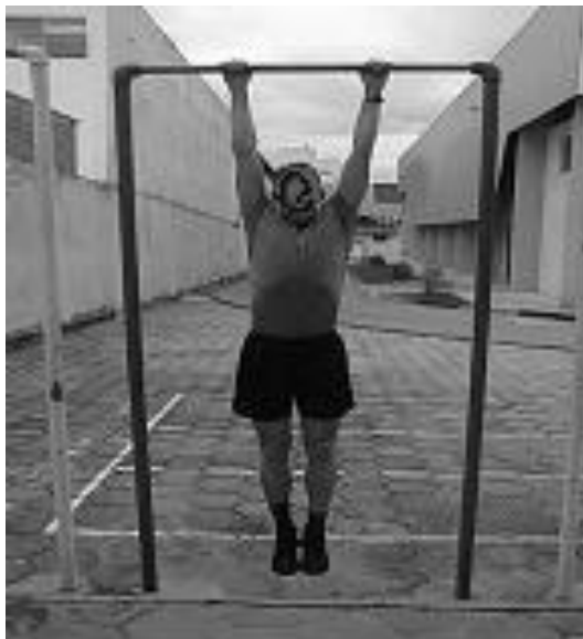
Figura 01 - Posição 1: Inicial

a.3) Número de repetições : Livre, a critério do candidato(a). Os pontos serão computados conforme tabela.