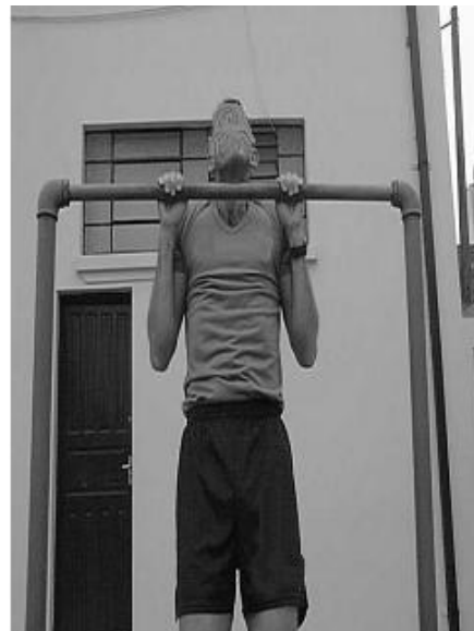
Figura 02 - Posição 2: Intermediária.