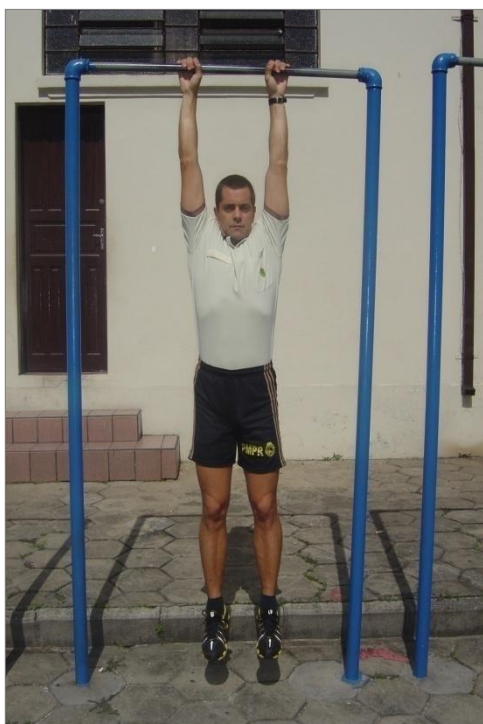
Figura 2 - Posição 1 inicial, e, Posição 3 final.

b.2. Número de repetições: conforme tabela “Anexo IV”.