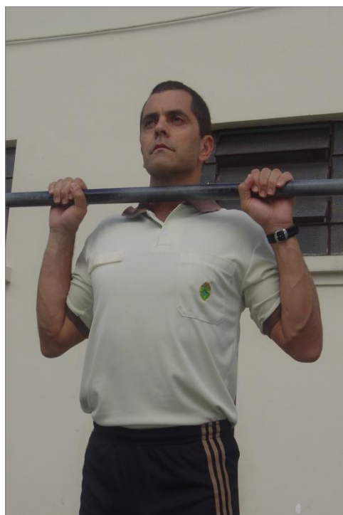
Figura 3 - Posição 2 intermediária.