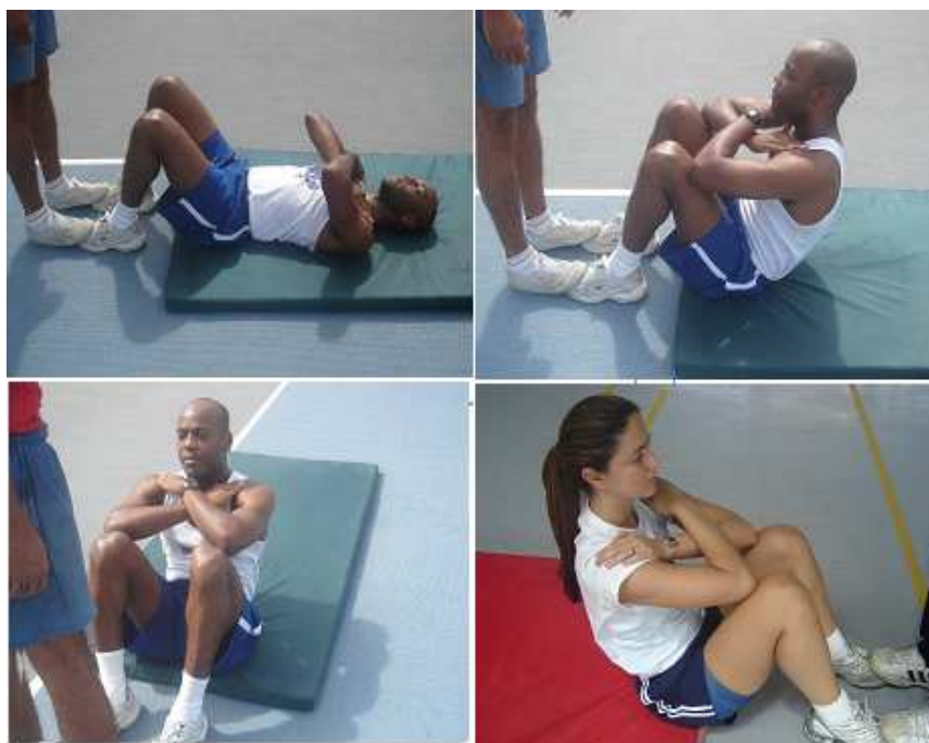
Figura 2- Flexão do tronco sobre as coxas

Obs.: Neste teste, serão exigidos os mesmos padrões de execução para ambos os sexos.