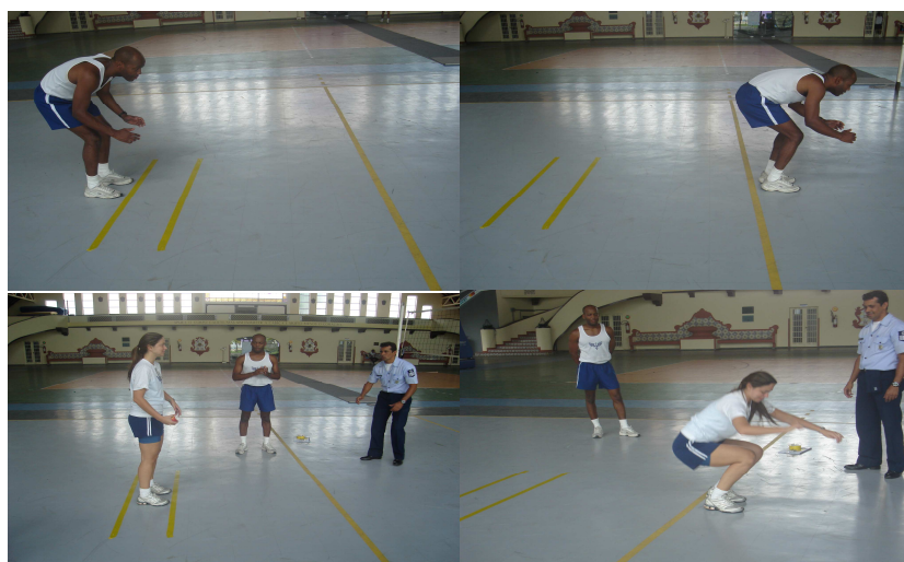
Figura 3- Teste de salto horizontal

Obs.: Neste teste, serão exigidos os mesmos padrões de execução para ambos os sexos