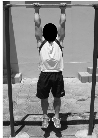
POSIÇÃO 3- Final do exercício