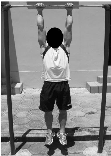
POSIÇÃO 1- Inicial