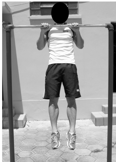
POSIÇÃO 2- Intermediária