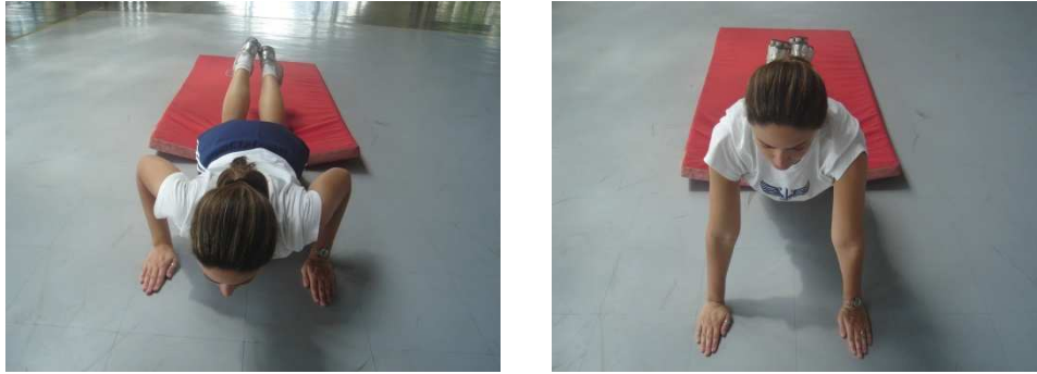
Figura 2 – flexão e extensão dos membros superiores com apoio de frente sobre o solo para o sexo feminino