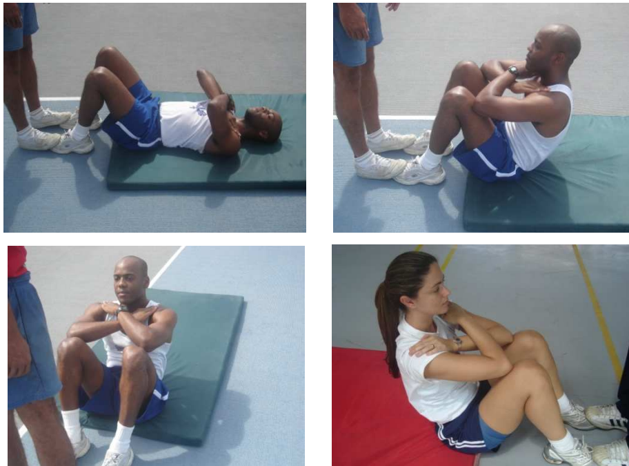
Figura 3 – flexão de tronco sobre as coxas para os sexos masculino e feminino

Será avaliada através da flexão do tronco sobre as coxas.