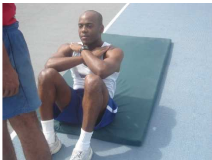
Figura 3 – flexão de tronco sobre as coxas.