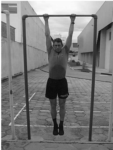
Figura 01 Posição 1 Inicial

d) Número de repetições: Livre a critério do candidato(a). Os pontos serão computados conforme a tabela.