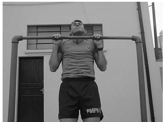
Figura 02 Posição 2 Intermediária.