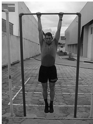
Figura 03 Posição 3 Final do Exercício